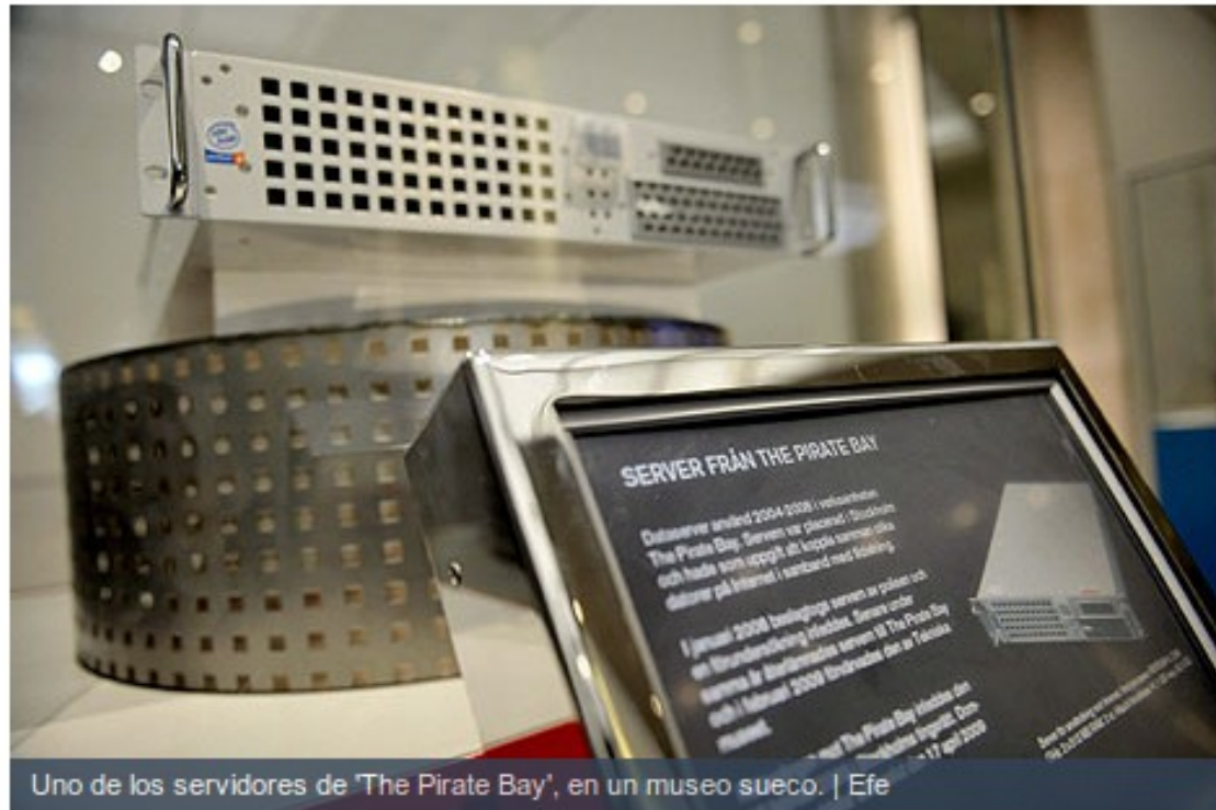
Uno de los servidores de 'The Pirate Bay', en un museo sueco.