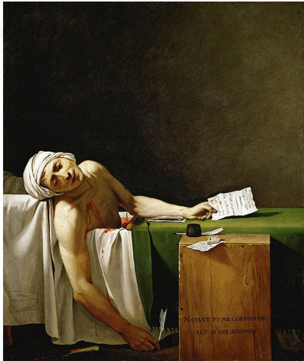
Balles de papier - Marat